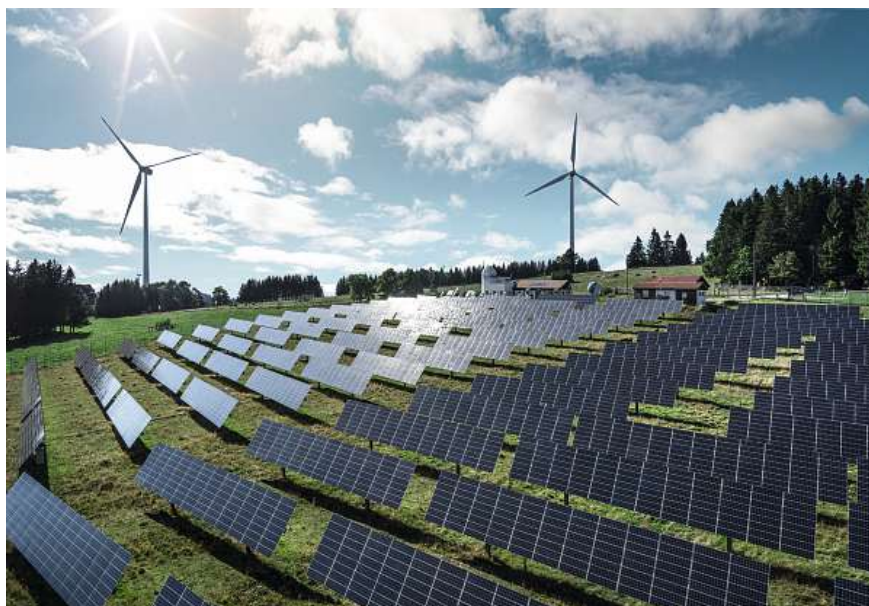
Bild 2 Ein Portfolio erneuerbarer Energien schafft noch keine Autarkie.

daschen, waschen oder die Unterhaltungselektronik nutzen. Dort werden zukünftig Wärmepumpen und Ladestationen hinzukommen (mit Ausnahme der Schnellladestationen).