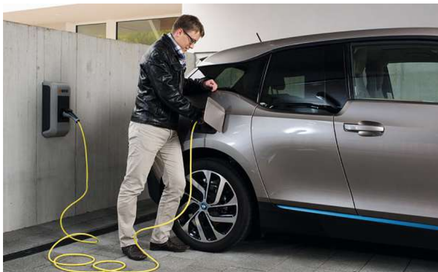
Bild 3 Der Leistungsbedarf kann mit einem smarten Lademanagement reduziert werden.

zukünftig ein Ferneingriff zur temporären Leistungsreduktion der Erzeugung und des Verbrauchs erfolgt, um eine unmittelbare erhebliche Gefährdung des sicheren Netzbetriebs abzuwenden.